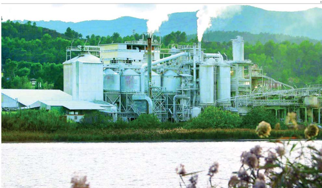
La inversión en medidas de protección medioambientales que no tengan carácter obligatorio ha descendido año tras año

tonces las empresas podían deducirse un 10 por ciento de las inversiones realizadas en este campo. Desde el año 2000 hasta 2007, el número de empresas que obtuvieron estas deducciones fue creciendo. Así, en el año 2000 hubo 3.400 declarantes con una deducción global de alrededor de 58 millones de euros, mientras que en el año 2007, hubo casi 6.000 declarantes y 124 millones de euros deducidos en total. En 2006, el Gobierno del PSOE realizó una reforma que preveía su eliminación progresiva para 2011, al reducir en dos puntos porcentuales cada ejercicio la deducción. Esto introdujo inseguridad entre el sector y derivó en una caída de declarantes. Sin embargo, en 2011, la Ley de Economía Sostenible, puesta en marcha por el Gobierno de José Luis Rodríguez Zapatero, recuperó la deducción del 8 por ciento».