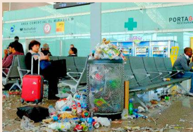
Los empleados de la limpieza del Aeropuerto del Prat, de Valoriza, fueron a la huelga por la modificación de las condiciones de trabajo.

A pesar de ello, el número de jornadas perdidas por huelgas, 83.113, bajó en un 31,2%, una caída que se queda en el 29,9% si se tienen en cuenta las horas perdidas. Como se ve en el cuadro superior, la incidencia de las huel-