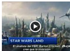
Disney desvela un inminente «Star Wars Land»