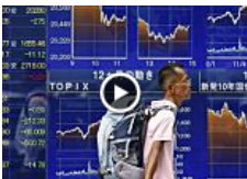
China sacude la Bolsa: qué está pasando