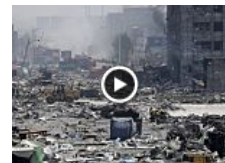
El puerto de Tianjin, el décimo del mundo en contenedores...