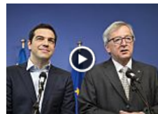
Diez puntos cruciales del salvavidas para Grecia